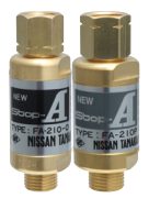
逆火防止器 NEW Stop-A 酸素用・プロパン用