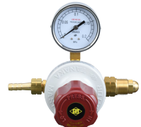
マスターVI LP 工業用LPG調整器の定番