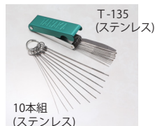
火口掃除針 10本組 (ステンレス)