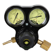
マスターVI OG 工業用酸素調整器の定番 関東式OG・関西式OF