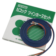
Nコック ツインホースセット