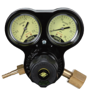
マスターVI OG 工業用酸素調整器の定番 関東式OG・関西式OF