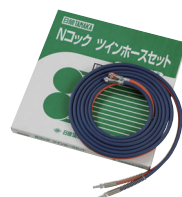
Nロックツインホースセット