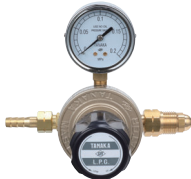
マスターIII LP 工業用LPG調整器の定番