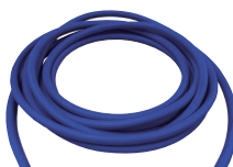
酸素用太径ホース (内径φ12)