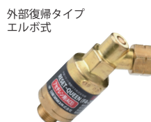
逆火防止器 リセットクイーン