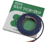
Nロックツインホースセット