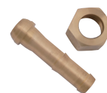
W20-16袋ナット & φ12ホース口