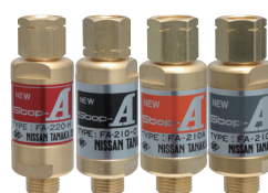
逆火防止器 NEW Stop-A