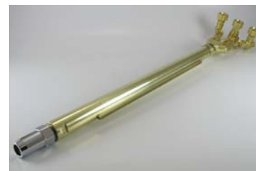
プロカットトーチ プロカット火口