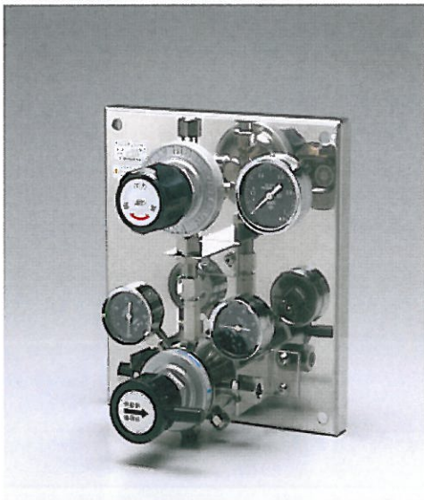
プリンスチェンジャー