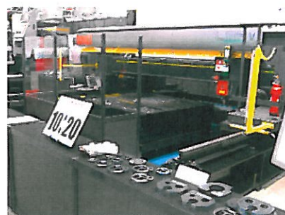
新製品 レーザ切断機 LMRV