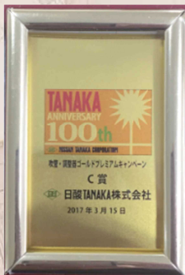
A賞・B賞・C賞 純金カード外観 ※写真一例：C賞

次は B 賞です！ B 賞の抽選は常務取締役の佃が担当いたしました。 合計 10 枚の応募はがきを、心を入れて抽選 BOX から 引かせていただきました。 C 賞、D 賞も同様に、厳正なる抽選を行いました。