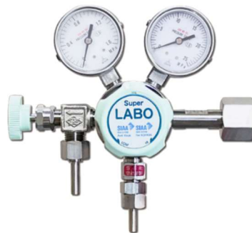
S/LABO S1 シリーズ

【お問い合わせ先】 日酸TANAKA株式会社 産業機器事業部 TEL：044-549-9647